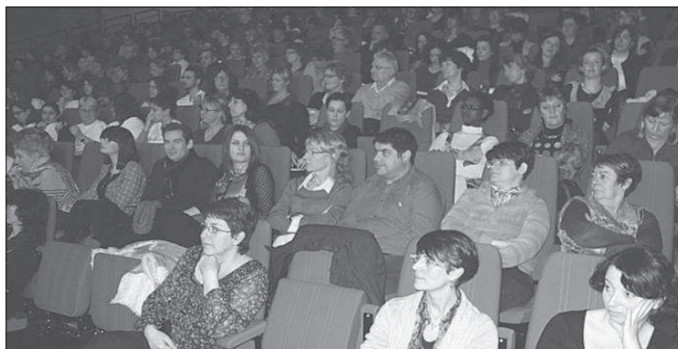
Un public particulièrement attentif, lors de ce colloque dédié à l'accueil des personnes âgées.

Ces besoins touchent un sujet sensible : le respect de la vie intime et affective des personnes âgées. Cette problématique se heurte encore à de multiples tabous qui induisent de véritables difficultés de prise en considération et, notamment, lors des soins. Avec le souci d'accompagner les professionnels dans l'évolution du suivi des personnes âgées, ce colloque visait à susciter les bonnes questions de la part du personnel de ces structures d'accueil. Il s'agissait aussi de sensi-